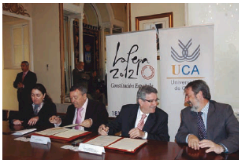
Durante la firma del convenio en el Rectorado

La Fundación, igualmente, será la encargada de gestionar los Centros de Interpretación del Bicentenario y un portal web que estará a disposición de estudiosos e investigadores así como de la ciudadanía en general, donde poder consultar el patrimonio documental digitalizado.