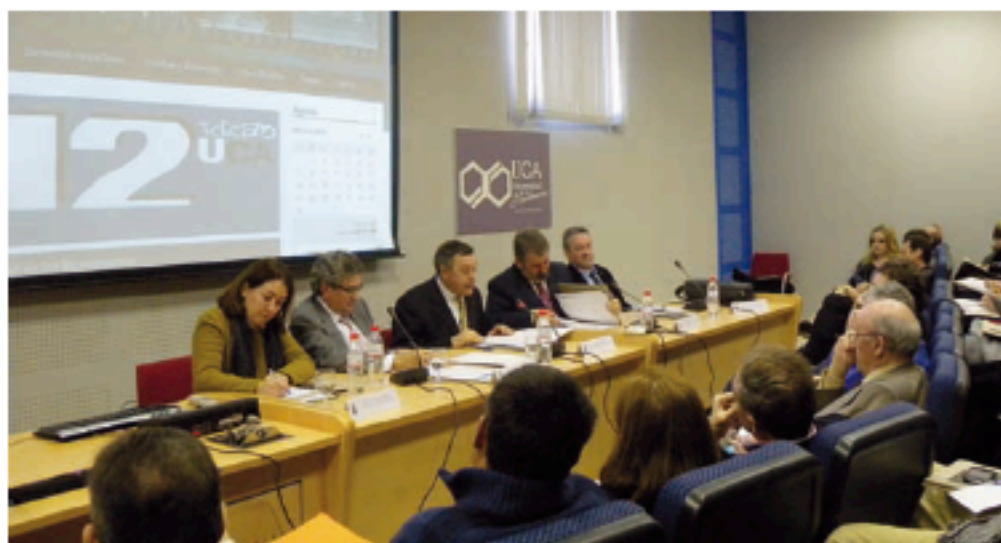
Congreso Andalucía y la Constitución 1812, primera jornada

El Congreso 'Andalucía y la Constitución de 1812' ha sido el evento académico más destacado del primer trimestre del año de los dedicados a la temática de la promulgación de la primera Carta Magna española. Se celebró el pasado mes de febrero con el objetivo logrado de hacer un balance de la influencia que la Constitución de 1812 tuvo en Andalucía, así como del papel protagonista que jugó esta comunidad autónoma en los hechos históricos de la primera mitad del siglo XIX. Un centenar de personas participaron en estas jornadas que organizaron la Consejería de Gobernación y Justicia de la Junta de Andalucía y las áreas de Historia Contemporánea de las Universidades Públicas de Almería, Cádiz, Córdoba, Granada, Huelva, Jaén, Málaga, Pablo de Olavide y Sevilla.