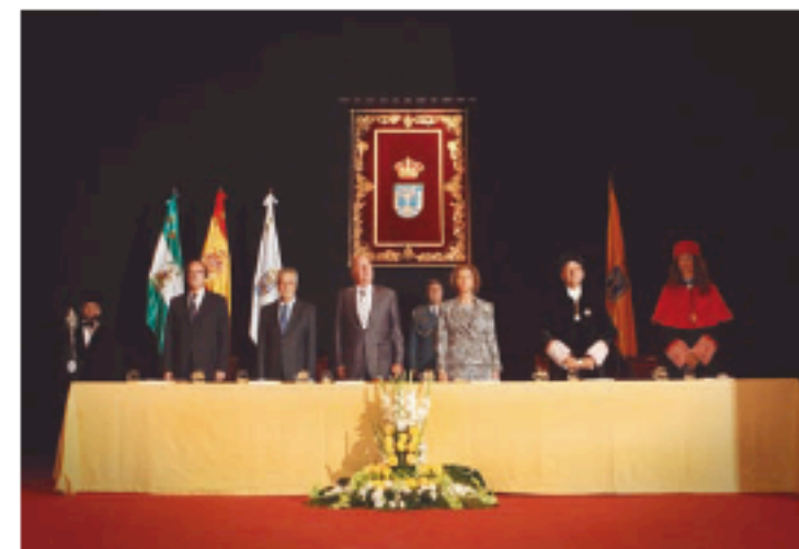
Foto de familia de los rectores de las universidades españolas.

Sus Majestades los Reyes de España presidieron el Acto de Apertura del Curso en el Teatro de las Cortes.