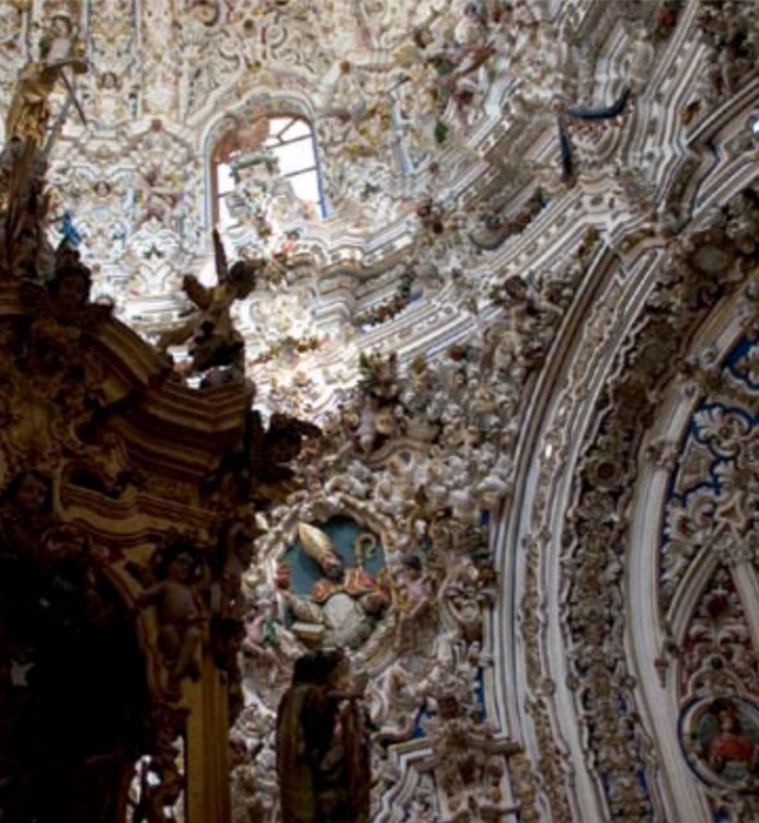
Sagrario de la Parroquia de San Mateo

Lucena fue una importantísima aljama judía en la edad media que gozó entonces de una gran prosperidad económica y cultural, desafortunadamente en el siglo XII