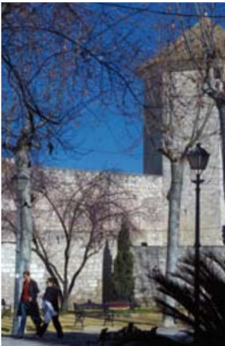
Castillo del Moral

De sus fiestas destacamos las Romerías de bajada y subida de Nuestra Señora de Araceli y, en mayo, las Fiestas Aracelitanas y dos eventos musicales el Festival Internacional de Jazz en mayo y el Festival Internacional de Piano Ciudad de Lucena en septiembre.