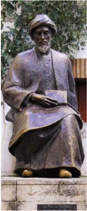
Estatua de Mai-mónides

Córdoba, situada en el centro de Andalucía, posee un patrimonio histórico-artístico de excepcional singularidad herencia de las diferentes culturas que la han poblado. Del período romano, cuando llegó a ser capital de la Bética, se conserva el Puente sobre el Guadalquivir, los restos del Templo Romano, del Palacio de Maximiano y Mausoleos Funerarios. Durante el período árabe se convierte en capital de Al-Ándalus, el monumento más representativo es la Mezquita, además hay que citar Medina Azahara y los baños califales. De la cultura judía se conserva el barrio de la Judería y la Sinagoga. En época cristiana, Fernando III destruye las mezquitas y en su lugar levanta catorce parroquias, son las Iglesias Fernandinas de las que se conservan hoy. De este período es también el Alcázar de los Reyes Cristianos y los Triunfos de San Rafael repartidos por la ciudad. Hoy es una ciudad moderna con hermosas avenidas, jardines y espacios de ocio y una atractiva oferta museística, citamos el Museo Arqueológico, Museo de Bellas Artes, de Julio Romero de Torres, de las Tres Culturas, del Agua, etc. En el río Guadalquivir, los Sotos de la Albolafia, declarado Monumento Natural cobijan una importantísima avifauna. No hay que perderse el mes de mayo preñado de fiestas como las Cruces, los Patios, y la Feria de Nuestra Señora de la Salud.