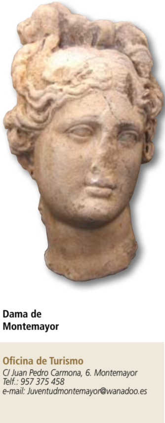
Dama de Montemayor

Oficina de Turismo C/ Juan Pedro Carmona, 6. Montemayor Telf.: 957 375 438 e-mail: Juventudmontemayor@wanadoo.es