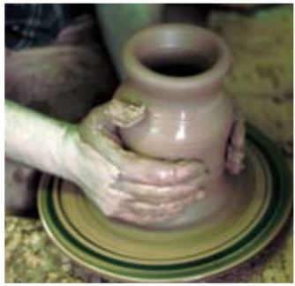
Artisano trabajando en el torno