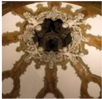
Cúpula del Sagrario en la Parroquia de Nuestra Señora de la Asunción

Aún quedan hornos morunos en funcionamiento en los que se cuecen cántaros, jarras de cuatro picos y botijos rambleños. Entre su patrimonio artístico destaca la parroquia de Nuestra Señora de la Asunción y el Torreón del Castillo; Bienes de Interés Cultural; la Iglesia de la Santísima Trinidad, la Torre de las Monjas y las casas solariegas. Hay que ver el Museo de Cerámica y el Museo Alfonso Ariza, escultor de la tierra. Dentro de las fiestas de San Lorenzo Mártir en agosto se celebra la Exposición de Cerámica, oportunidad única para conocer la producción local.