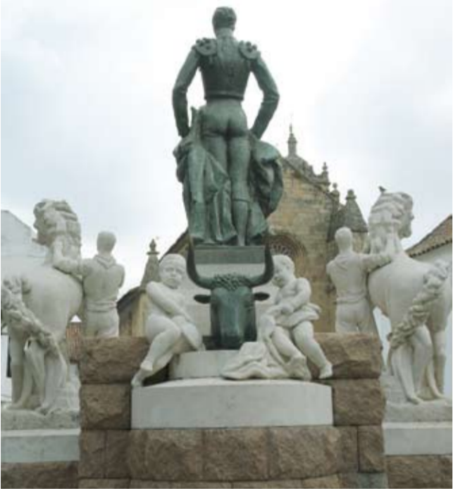
Monumento a Manolete