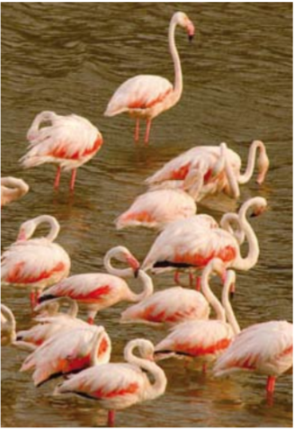
Flamencos en la Laguna de Zóñar

Su Semana Santa está declarada de Interés Turístico Nacional, son muy atractivas la celebración del día de San Juan y de la Candelaria en febrero, la Cata del Vino y la Noche de la Media Luna en julio en la que se revive el período andalusí.