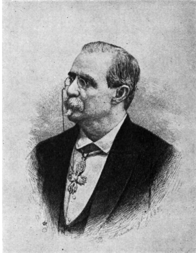
Cánovas del Castillo, por Maura

Reichstag por el socialismo alemán. Precisamente, quizá porque Cánovas tenía una noción exacta de las realidades sociales, fue por lo que su ley electoral censitaria quedó al margen del texto constitucional.